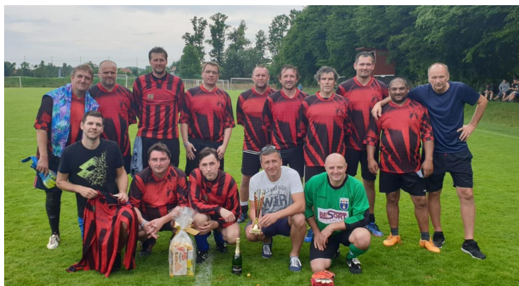
Družstvo starých pánů