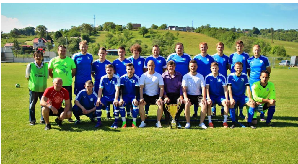
Družstvo mužů